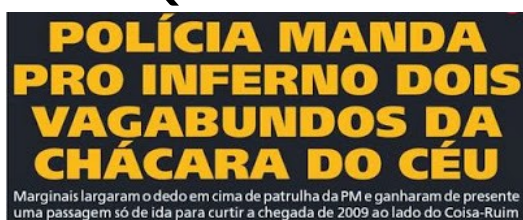
figura de linguagem que aparece na manchete acima é: